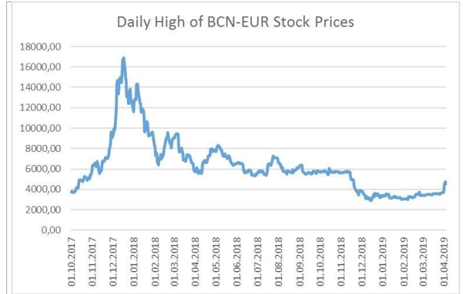
Abb. 1: Entwicklung des Bitcoin-Euro-Kurses 01.10.2017-04.04.2019

Einige Monate nach dem Fall der Kurse verzeichneten ANSSI und BSI einen signifikanten Rückgang im Bereich Cryptocurrency-Crime, insbesondere beim Cryptojacking. Wie bereits im ersten Lagebild festgestellt wurde, ist Monero die am stärksten genutzte Kryptowährung beim Cryptojacking. ANSSI und BSI stellen fest, dass das Cryptojacking unprofitabel wurde und viele Schadprogramme zu diesem Zweck ihre Aktivität wegen der gesunkenen Kurse eingestellt haben 1,2 .