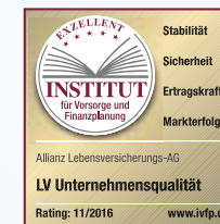
LV Unternehmensqualität Stand: 11/2016