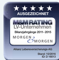
Bilanzjahrgänge 2011–2015 Stand: 10/2016; ID: D 16013

Für eine langfristige Vorsorge brauchen Sie einen zukunftssicheren Partner. Anerkannte Ratingagenturen zeichnen die Allianz Lebensversicherungs-AG regelmäßig mit Bestnoten für Qualität, Finanzkraft und Sicherheit aus.