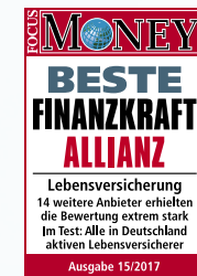
Beste Finanzkraft Ausgabe: 15/2017