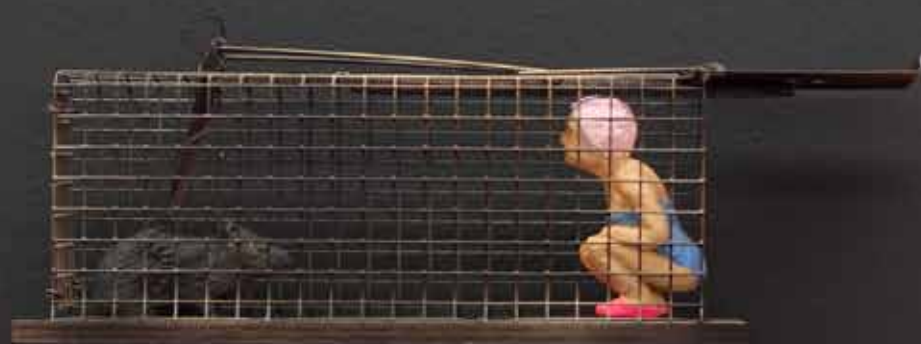
Mausefalle | Terrakotta | 36,5x11x12 cm | 2015