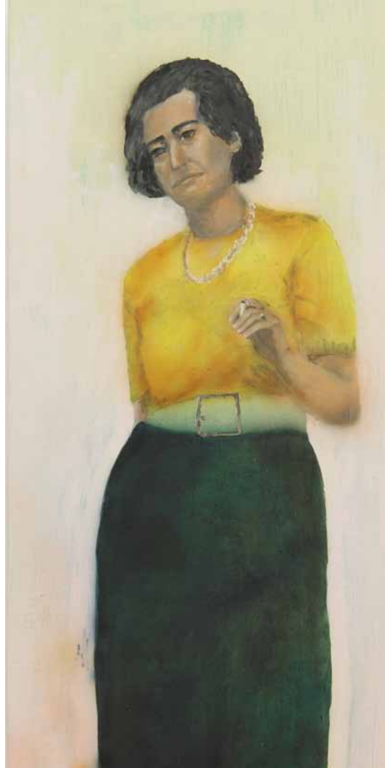
Hannah Arendt 100x50 cm | Acryl auf Holz | 2015