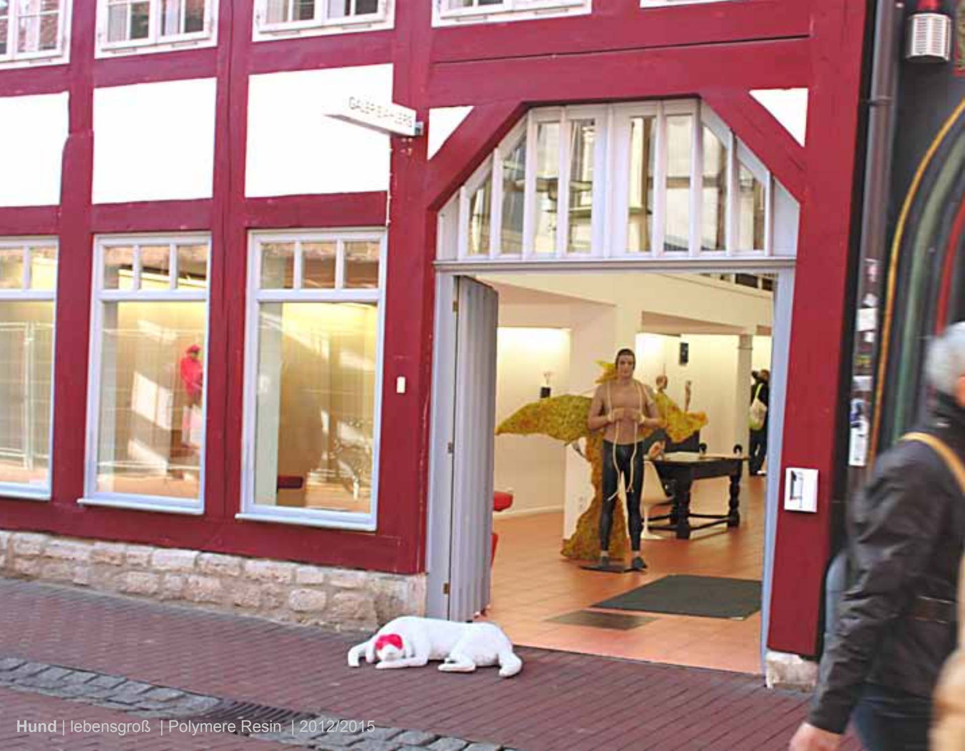
Hund | lebensgroß | Polymere Resin | 2012/2015