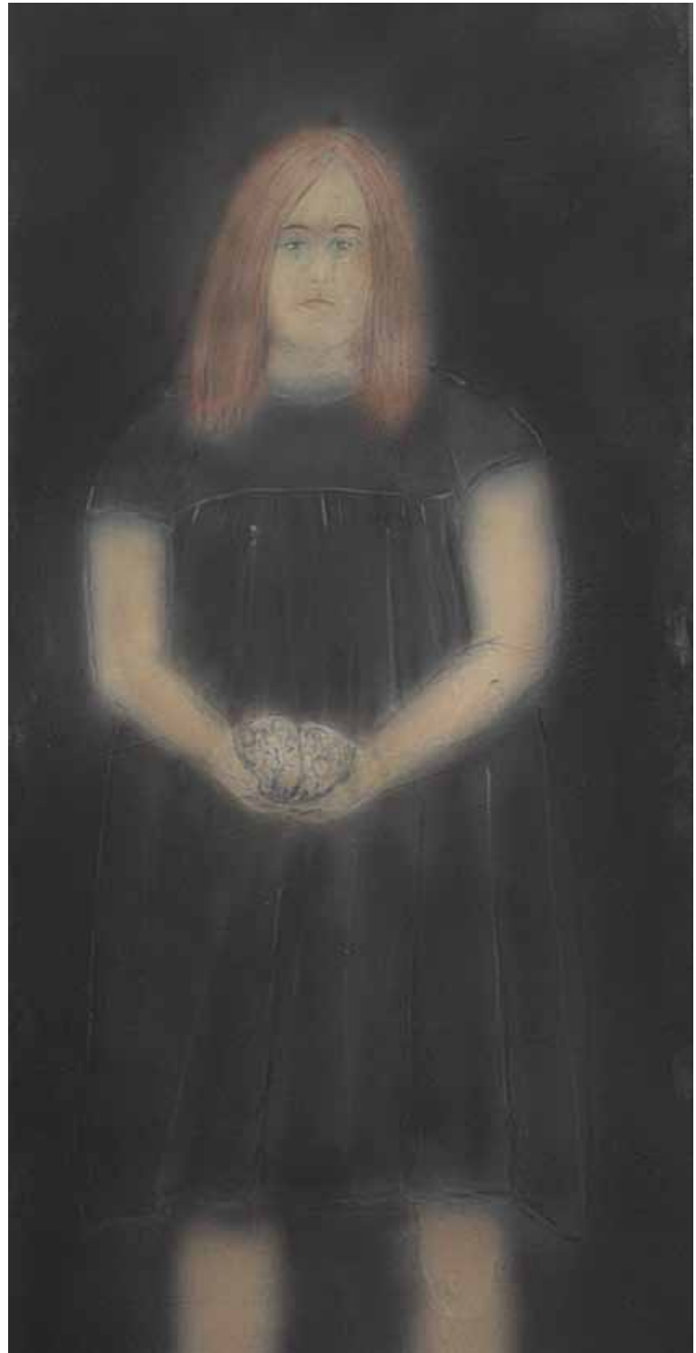
Für die Wissenschaft 100x50 cm | Acryl auf Holz | 2015