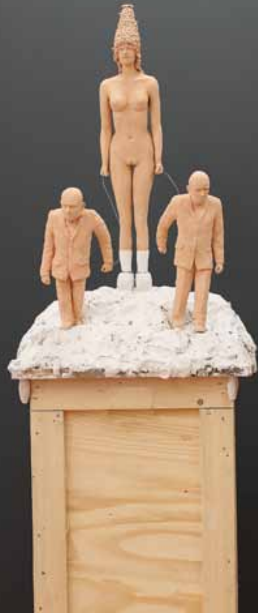
Die Bewunderte | Terrakotta, Gips, Holz | 65 cm h. | 2015