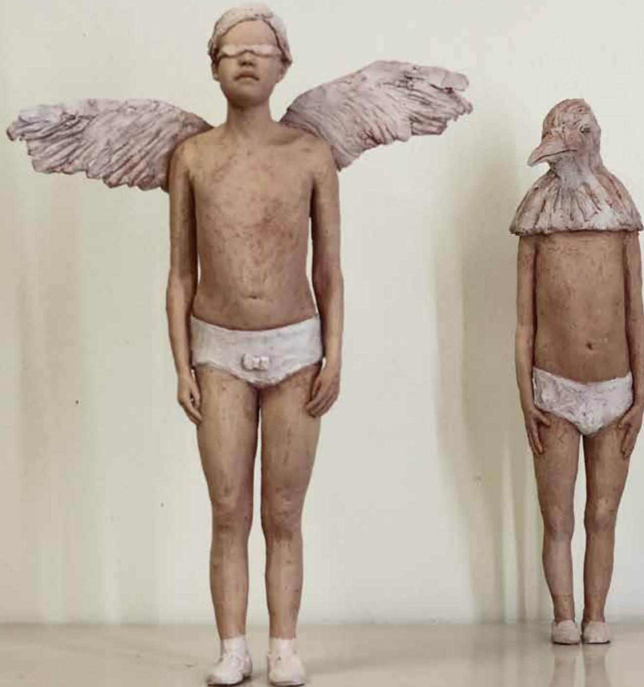
Rheinromantik (Möwenkinder) | 9 teilig | mixed Media | 2015