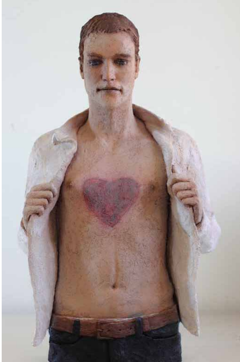
Herzzeitloser | Terrakotta | 80 cm | 2015