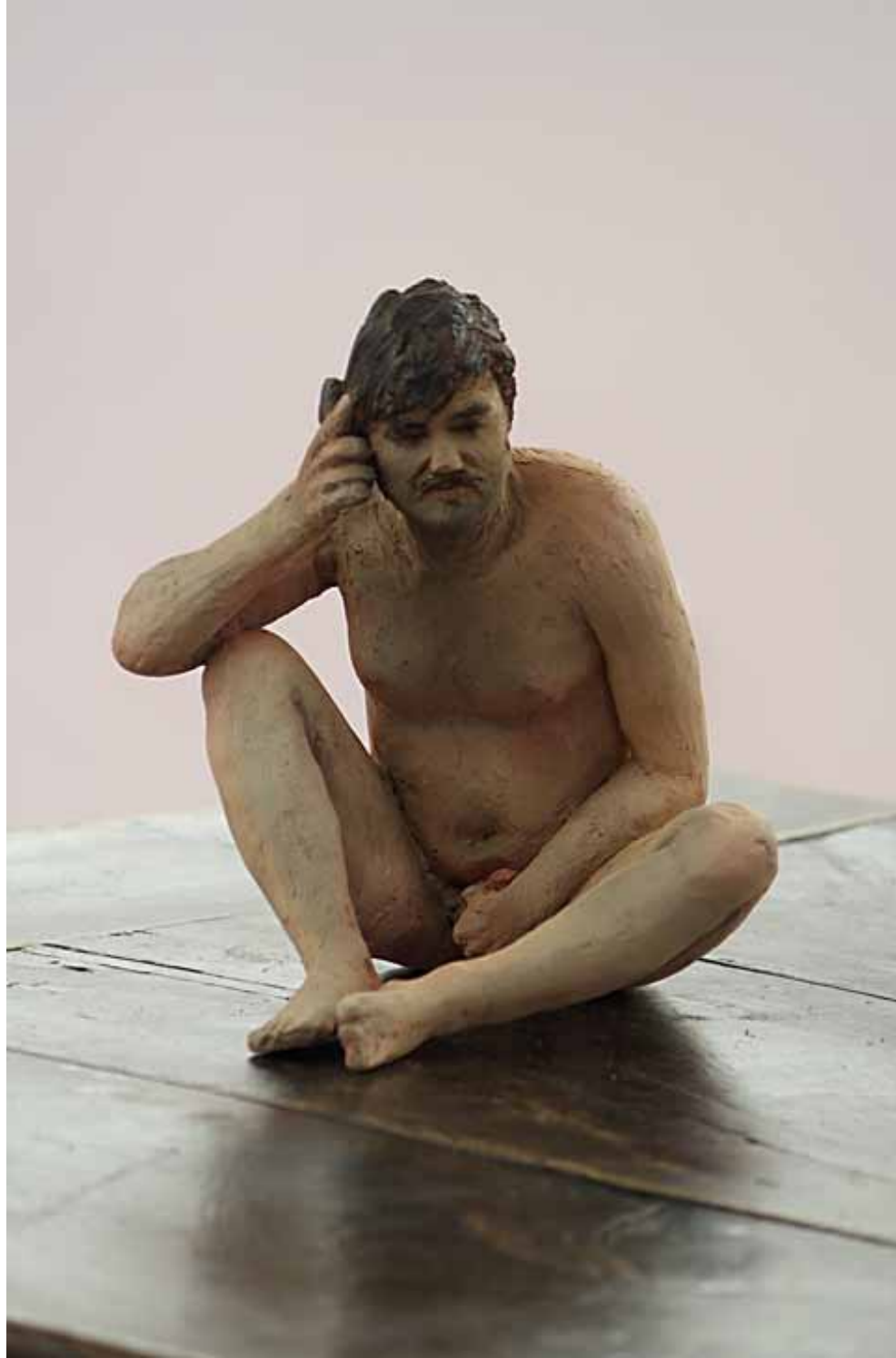
R.W. Fassbinder | Polymere Resin | 25 cm hoch | 2015