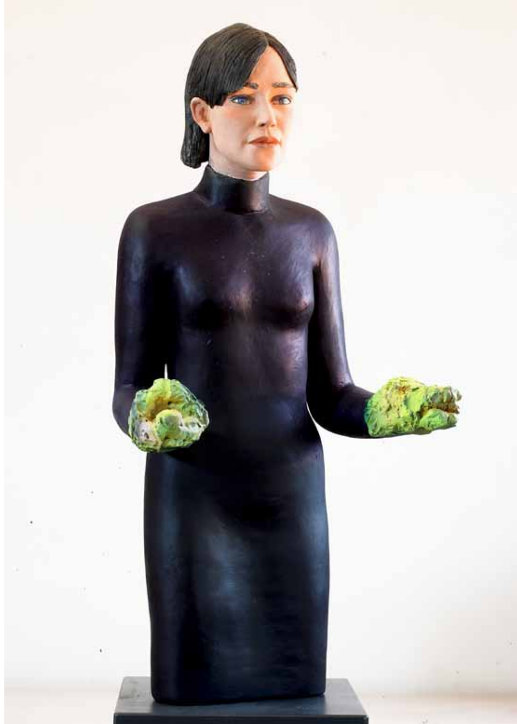
Spielerin | Terrakotta | 80 cm | 2014