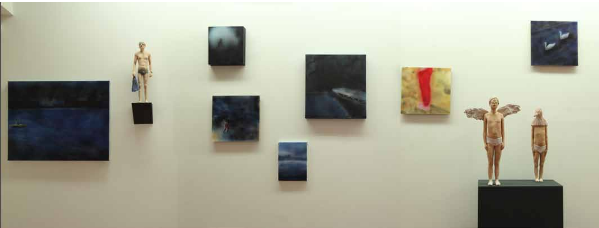
Rheinromantik | 9 teilig | mixed Media | 2015