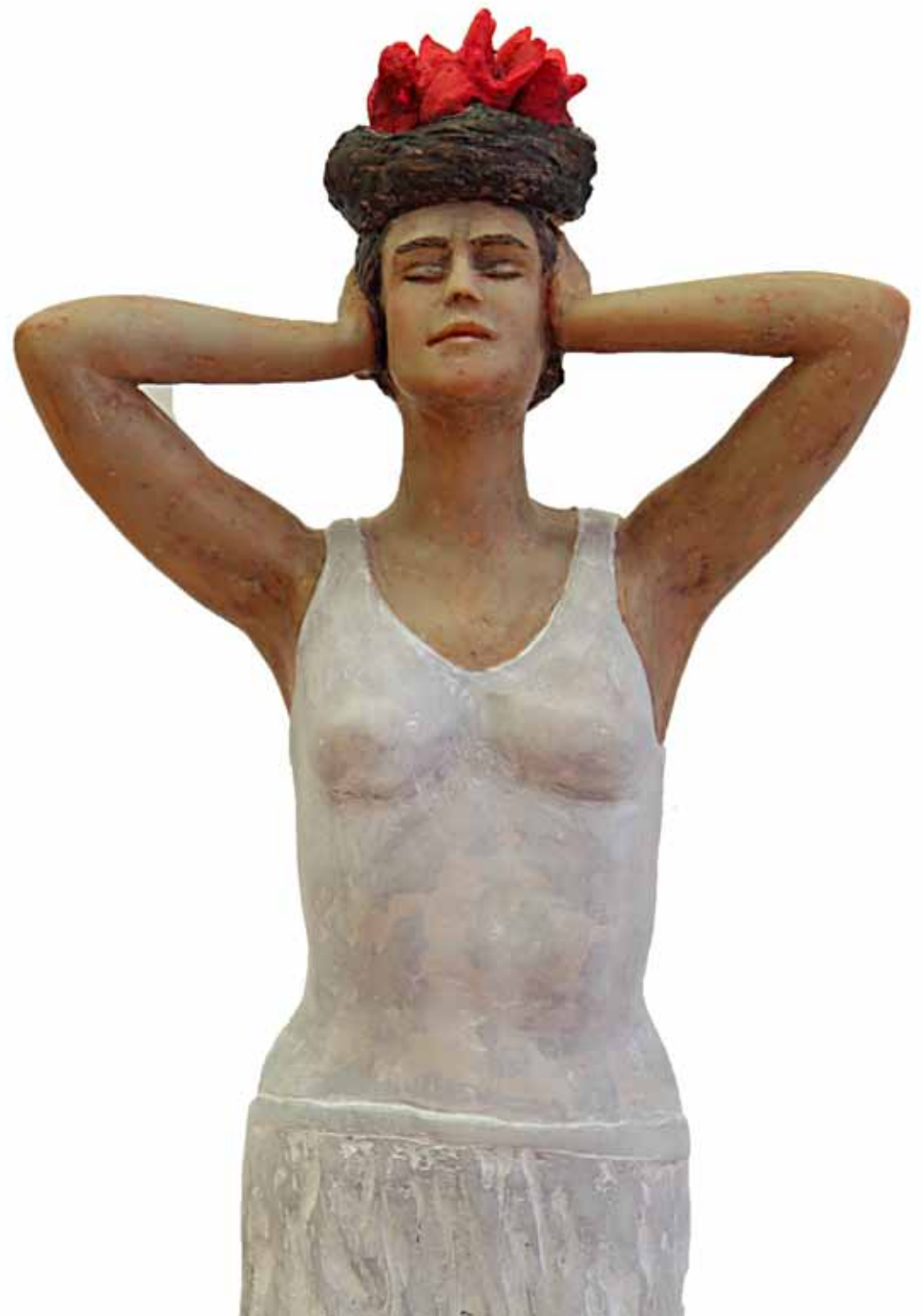
Eingenistet | Polymere Resin | 65 cm hoch | 2015