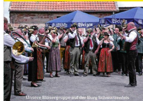
Unsere Bläsergruppe auf der Burg Schwarzenfels

Aktuelles und Wichtiges erfahren Sie unter www.kjb-schluetchern.de Schauen Sie rein, ein Blick mit Klick.